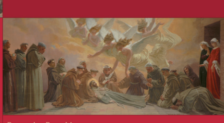
Domenico Bruschi. La morte di San Francesco. Assisi, Basilica di Santa Maria degli Angeli in Porziuncola