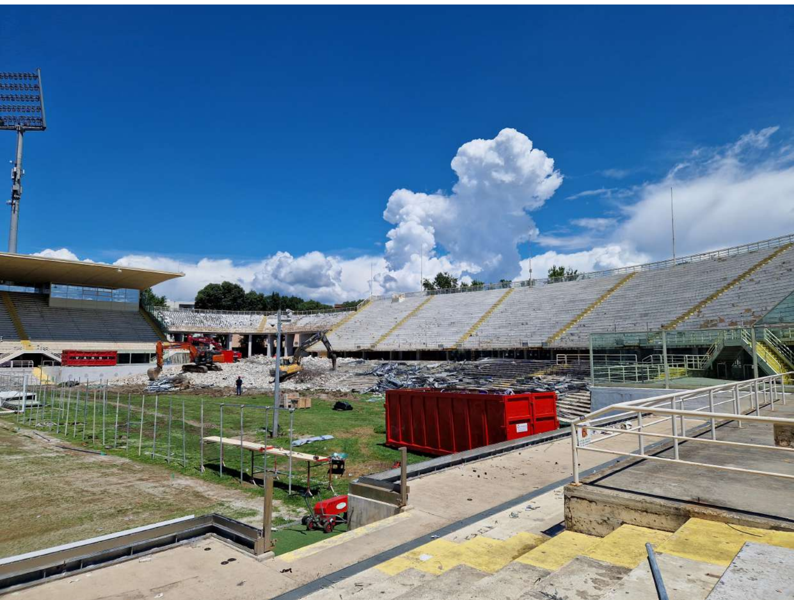
Demolizione del parterre di Curva Fiesole, elemento realizzato in occasione di Italia '90.